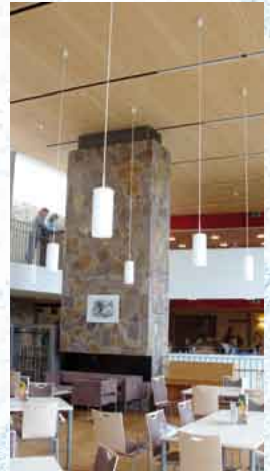
Links: Tagesbetreuungsstätte/Brunn am Gebirge – individuelle Planung • Mitte oben: Spa Hotel Bründl/Bad Leonfelden – optimale Qualität • Mitte unten: Betriebsgebäude ASFINAG/Ansfelden – perfektes Raumklima • Rechts: Landespflegeheim/Stockerau – besondere Vielfalt

G roßes Lob für Perchtold Trockenbau gab es bei der Realisierung der neuesten Projekte. • Von der Marktgemeinde Brunn am Gebirge wurde dem Perchtold-Team ein spezieller Auftrag erteilt. Gemeinsam mit dem dort zuständigen Planer wurde die individuelle Planung und Gestaltung der örtlichen Tagesbetreuungsstätte entwickelt. Mit Fingerspitzengefühl und Know-how erfolgte die Ausarbeitung eines einzigartigen Konzepts, das