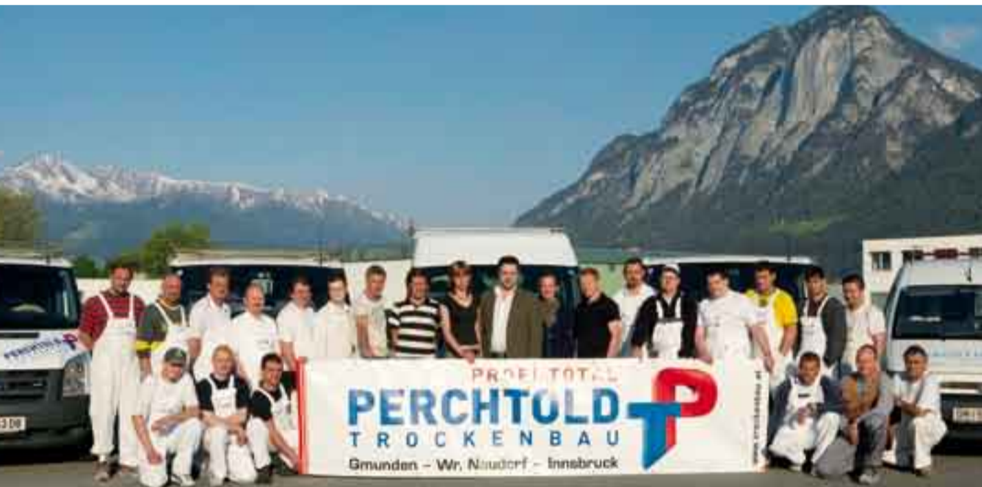
Motiviert, kompetent und sympathisch: Das Innsbrucker Perchtold-Team

Seit dem vorigen Jahr werden auch im Westen Österreichs Kundenwünsche noch rascher und effizienter erfüllt. Die wachsende Auftragslage im Großraum Tirol und Vorarlberg war der Grund für die Errichtung einer eigenständigen Filiale der