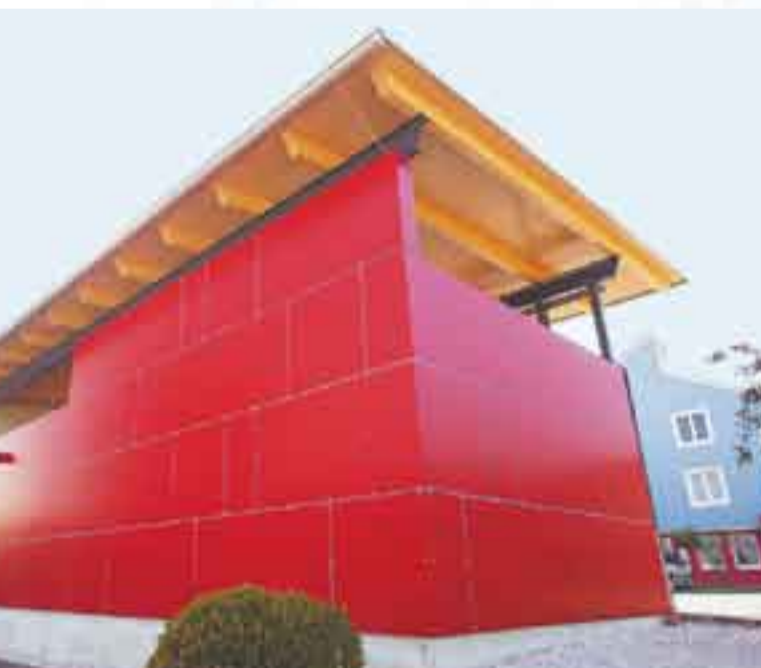
Alu-Verbundplatten: Die perfekte Kombination aus Funktionalität, Qualität und Design